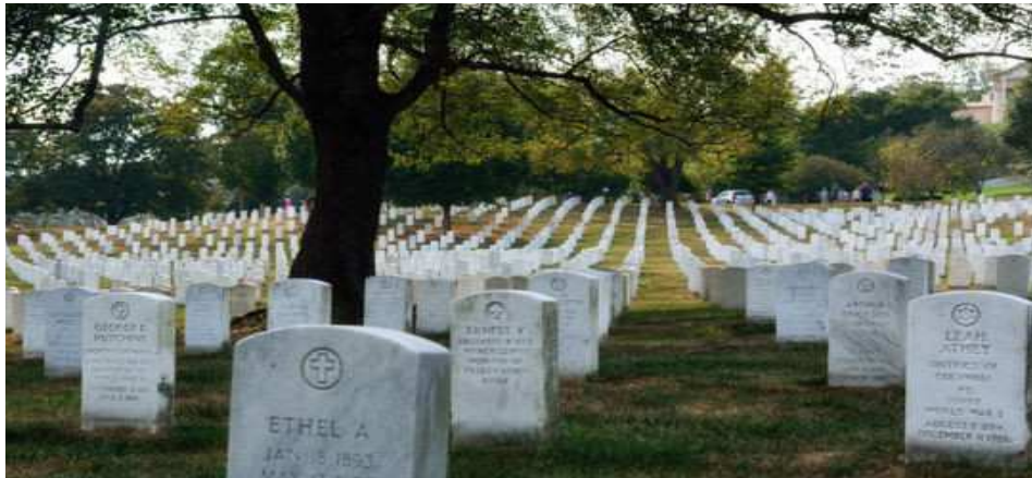
美國阿靈頓（Arlington National Cemetery）國家級軍人公墓。

緣被告蕭○○為○○鄉公所之約僱人員，於 93 年至 99 年 5 月間擔任公墓管理員，並負責○○厝公墓更新期間之「鐵皮屋暫時收納骨灰甕、開立納骨塔位申請書、繳款書予辦理進塔之民眾、安排民眾辦理進塔、製作使用塔位登記名冊等」事宜，蕭○○明知依據○○縣○○鄉立殯葬設施使用管理自治條例第 4 條規定，民眾申請使用納骨塔位，須先請公墓管理員開立「公墓墓基暨納骨堂使用申請書」與「公墓管理使用費繳款書」，並持該「繳款書」至縣農會代理○○鄉公庫繳納使用費後，再持該「使用申請書」、「使用費繳款書」收據聯及亡者死亡證明書等文件，始能使用納骨塔位，蕭○○無權自行收取納骨塔位使用費，也無意代為繳納，竟意圖為自己不法之所有，利用職務上開立「使用申請書」之機會，分別於 93 年與 97 年間，在○○厝公墓辦公處所，刻意未開立繳款書予申請人，並分別詐取申請人王○源及楊○交付之納骨塔使用費計 92,000 元。而被告李○○則為道士，以擇日、辦理法會及幫民眾選擇塔位、代繳納骨塔使用費為業，其因常至該鄉○○厝公墓幫客戶選塔位，而與蕭○○熟識，李○○乃利用其與蕭○○友好之關係，於 97-99 年間，3 次讓各該亡者的骨灰甕，在未交付繳款收據之情況下，得以先辦理進塔，卻意圖為自己不法之所有，將此等客戶於進塔日期左右，交付其代為至○○鄉農會代理○○鄉公庫繳款之現金，分別予以侵占入己。案經法務部調查局○○縣調查站移送台灣雲林地方法院檢察署檢察官偵查起訴。