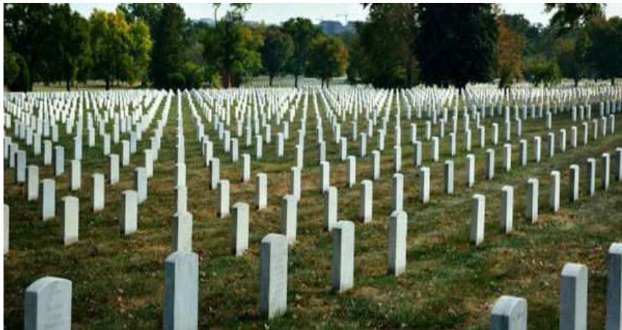
美國阿靈頓（Arlington National Cemetery）國家級軍人公墓。

己○○為○○鄉公所社會課公墓管理員，明知乙○○為其死亡之配偶陳○瑋申請起掘證明書，未繳交其墓地位置照片，仍於 92 年 5 月 7 日在墓墓地遷葬申請登記冊內備註欄內，登載「相片已交」，並於該所起掘證明書內，登載陳○瑋現葬於本鄉土地內屬實，准予起掘遷移之不實事項後，核發予乙○○行使之，足以生損害於該所墓地遷葬管理之正確性。戊○○則為宜蘭縣立殯葬管理所○○鄉福園之管理員，與福緣禮殯服務社負責人丙○○勾結，轉介非本籍申請入納與使用福園之申請案予丙○○代辦手續，惟為使申請人乙○○願意接受丙○○之服務，明知亡者陳○瑋非葬於宜蘭縣境且非屬宜蘭縣民，且與乙○○之關係為夫妻。戊○○與丙○○竟基於共同之概括犯意聯絡及行為分擔，以虛偽之手法，分別連續 2 次由丙○○利用不知情之不詳之他人（代筆），於「納骨廊（塔）使用申請書」及「靈柩（骨灰骸）入館申請書」內填寫不實內容，再由戊○○依前開偽造之申請書表件，於核發之許可證明書內應記載事項為不實登載，並交付申請人行使之，均足以生損害於申請人及福園對於殯葬管理之正確性。案經宜蘭縣調查站移送臺灣宜蘭地方法院檢察署檢察官偵查起訴。