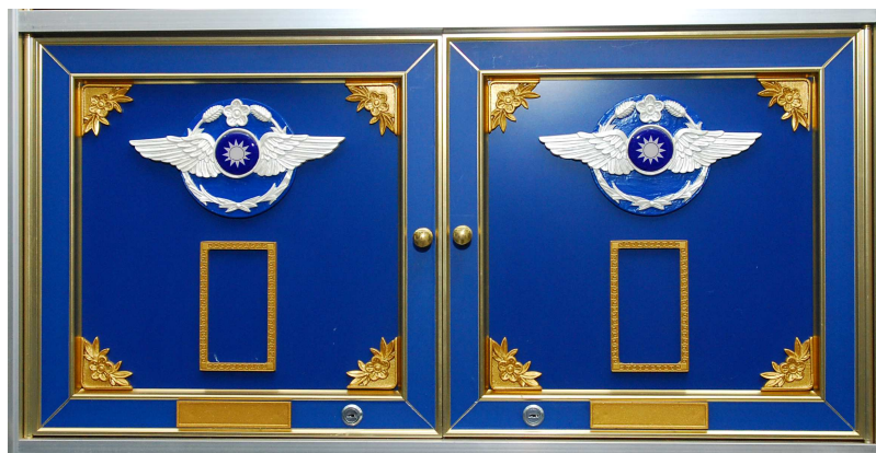
空軍烈士公墓納骨堂雙龕規格：高 29cmX 寬 59cmX 深 29cm（外緣）

甲○○係○○市立殯葬管理所火葬場技工，負責焚化屍體等職務。緣於 93 年 6 月間，任職於三立電視公司之新聞從業人員楊○化自坊間聽聞只需給付甲○○新台幣 5,000 元，則不論係何種物品，均可在○○殯葬管理所之火葬場焚化。楊○化對此傳聞頗感好奇，為查證真實性，其與兩位朋友先於 93 年 6 月 13 日上午，將預備之豬骨頭、西瓜及若干廢棄物裝入屍袋，再放進棺木中，並以長鐵釘密封，佯裝成蔭屍，再於同日上午 10 時許，以三立電視公司之室內電話，撥打甲○○所持用之行動電話，假意詢問能否代為火化蔭屍等語。甲○○接獲電話後，明知不法，竟基於收受賄賂之犯意，不僅未要求需檢附准許火化之證明文件，亦未說明需先繳納規費始能火化，…僅簡單表示只需於同日下午 2 時許，將蔭屍送抵基隆殯葬管理所火葬場後即可。甲○○於同日下午 2 時許，在基隆殯葬所火葬場與楊○化等人會面，…，隨即親自將上開棺木送進焚化室火化。在等待焚化之過程中，甲○○不動聲色，逕自收受楊○化所準備之 5,000 元，作為違背職務之代價。因認被告涉有貪污治罪條例第 4 條第 1 項第 5 款之違背職務受賄罪嫌。