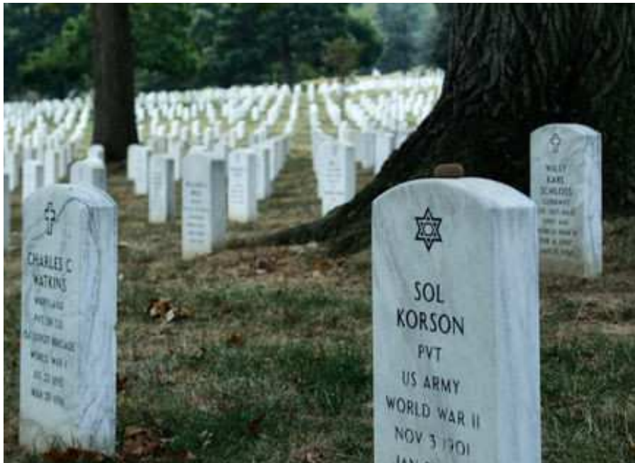
美國阿靈頓（Arlington National Cemetery）國家級軍人公墓一景。

被告丁○係鐵棚架工程業者，為從事業務之人。緣丙○○為辦理其父之喪事，遂委託丁○負責搭設丙○○之父靈堂棚架。丁○明知搭設棚架應注意設置足夠之警示標誌，並將往來道路封阻，以避免其他駕駛人因誤認可通行而駕車撞擊棚架及其相關固定物，而依當時之情狀，亦無不能注意之情事，竟疏未注意及此，於民國 98 年 2 月 5 日上午 8 時 30 分許，在臺東縣臺東市○○街自宅前之馬亨亨大道機車道上設置靈堂棚架時，竟未設置足夠之警示標誌，亦未將棚架左側所留道路封阻，嗣同日上午 11 時 9 分許，適有黃○政騎乘重型機車，行經上開機車道，亦未注意車前狀況，誤認前開通道可供通行，貿然駛入，而遭棚架鐵架固定繩索絆摔倒地，頭胸腹部遭受撞擊，致黃○政顱內出血、腹腔內出血不治死亡，被告丁○及丙○○應負過失致死罪責。案經檢察官相驗後自動檢舉偵查起訴。