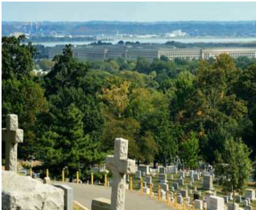
美國阿靈頓（Arlington National Cemetery）國家級軍人公墓一景。

被告葉○○原任職於○○縣政府警察局○○分局○○分駐所，擔任巡佐兼副所長，竟基於收取殯葬業者賄賂之犯意，於民國 96 年 8 月 10 日處理某父子溺死案件時，以電話通報殯葬業者楊○學前來協助處理屍體事宜，並在○○鄉境內某處向證人楊○學索取每具屍體新臺幣 10,000 元之賄款。惟證人楊○學認雖一案二屍，惟亦僅單一報驗案件，故初不同意 20,000 元之賄款金額，雙方協商後約定賄款金額為 12,000 元。同年 8 月中下旬，證人楊○學至前揭分駐所，基於行賄之犯意，將 5,000 元之紅包交由被告收取，惟因證人楊○學生活困窘，遲不付尾款，被告竟在同年 10 月 1 日下午及 10 月 5 日晚上，在電話中向證人楊○學追討尾款而索賄。檢察官因認被告涉犯貪污治罪條例第 5 條第 1 項第 3 款之不違背職務要求、收受賄賂罪嫌而提起公訴。