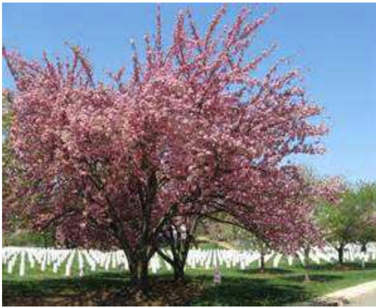
美國阿靈頓 (Arlington National Cemetery) 國家級軍人公墓。

緣某市殯葬管理所僱用之約僱人員詹○○與臨時人員徐○○均服務於該所殯儀組火葬班，負責遺體火化及撿骨等工作。其 2 人前於擔任前開職務時，均因收賄經法院判處有罪，並於 100 年 12 月 19 日確定。詎其 2 人仍不知悔改，又於 100 年 8 月 17 日上午 11 時許(在上開案件審理期間)，利用某禮儀公司負責人高○○受託辦理蕭○○遺體火葬業務之機會，於棺材送進火化爐之際，收取 2,000 元之賄賂。嗣其 2 人復另行起意，共同基於對於職務上之行為收受賄賂之犯意聯絡，於 100 年 9 月 10 日下午 1 時許，利用高○○受託辦理林○○遺體火葬業務之機會，再度收取 2,000 元之賄賂。案經廉政署調查後移送臺灣○○地方法院檢察署檢察官偵查起訴。