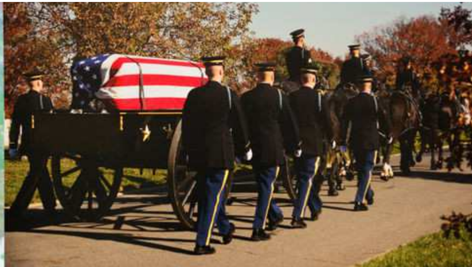
美國阿靈頓（Arlington National Cemetery）國家級軍人公墓一景。

被告廖○○係南投縣○○鄉鄉長；被告黃○○該鄉公所代理秘書，共同基於圖利他人之概括犯意，自 92 年 3 月 13 日起至 95 年 1 月 3 日止，對同鄉鄉民張○華等 20 人所提之陳情免費使用納骨堂及安置神旨牌位案，明知渠等 20 人申請條件與該鄉「公墓使用暨公墓公園化納骨堂管理辦法」等規定不符 1 ，卻仍以渠等 20 人處境堪憐為由而准予免繳納納骨塔進塔、安置神旨牌位費用，連續圖利渠等每人 8,000 元至 35,000 元不等費用。而被告巫○○則為該鄉公所前任代理秘書，亦明知依該鄉「公墓公園化暨納骨堂管理辦法」之規定，除本鄉列冊有案之一款低收入戶死亡時，可免申請許可費外，並無減半收費之規定，竟於 91 年 2 月 22 日，適該鄉鄉民曾○義向該所陳情，以「家境清寒、媳婦離家出走及 3 名子女需教育」為由，檢附陳情書及村長核發之清寒證明書，要求減半納骨塔費用即 13,500 元，詎被告巫○○經向廖○○報告後，鄉長復承前揭概括犯意，並與巫○○共同基於圖利他人之犯意聯絡，由巫○○依據廖○○之指示，而以代決行方式同意減半收費，以圖利曾○義計 13,500 元。檢察官因認被告 3 人所為，均涉犯貪污治罪條例第 6 條第 1 項第 4 款之圖利罪嫌而提起公訴。或採書面監辦時，應事先簽核，以免因忽略監辦，致生弊端。