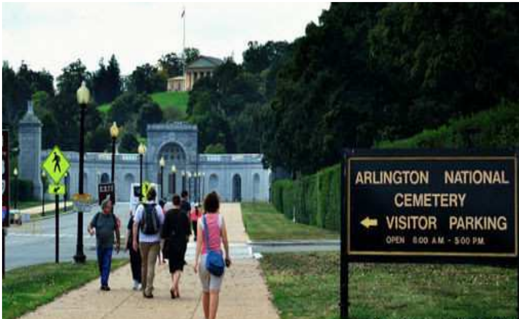
美國阿靈頓（Arlington National Cemetery）國家級軍人公墓大門。

丙○○原係○○鄉公所 93 年 2 月 13 日僱用之托兒所保育員之職務代理人，至 94 年 3 月 21 日改僱用為臨時業務助理人員，迄離職日止，其於該所服務期間，係依鄉長指派擔任該公所出納之助理人員，負責承辦該所第五公墓納骨堂規費之收取、保管及繳入公庫之業務。詎丙○○因個人財務狀況不佳，竟自 93 年 3 月 1 日起至 95 年 8 月 11 日止，在收取民眾繳納使用納骨堂之相關規費後，意圖為自己不法之所有，在不同(125 人/次)繳費之日期時間，將民眾繳納之規費計有 2,180,950 元侵占入己，用以支應自己資金之週轉。嗣經該縣審計室到所抽查財務收支，而發現納骨堂之規費收入繳庫有異常。案經法務部調查局○○縣調查站移送臺灣臺東地方法院檢察署檢察官偵查起訴。