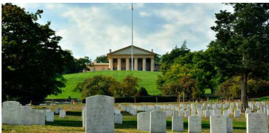
美國阿靈頓（Arlington National Cemetery）國家級軍人公墓。

緣○○鄉於 93 年 9 月籌辦「該鄉公墓公園納骨堂內部設備統包工程」期間，因固名公司實際負責人己○○有意與興全公司合作，而以興全公司名義參與工程投標，乃透過與該鄉公所主任秘書乙○○熟識之尹隆公司負責人甲○○介紹連繫，與該鄉長丙○○約定請該鄉公所人員協助興全公司得標，並由己○○給付預估總工程經費 25% 之代價之總額賄款給鄉長丙○○。雙方談妥付款方式後，己○○即於 93 年 10 月間某日，相約在甲○○住處，由己○○先後交付 425 萬元予甲○○，委由其將款項轉交予乙○○，再由乙○○悉數轉交予丙○○。嗣於 93 年 12 月 28 日系爭工程進行評選，興全公司未獲標案。丙○○將前開已取得之賄款，由乙○○分 2 次交還予己○○。丙○○、乙○○嗣於偵查中自白上情。 1 另被告廖○○、黃○○、管○○等 3 人於民國 93 年間受聘為該所辦理「公墓公園納骨堂內部設備統包工程」標案之評選委員，竟於系爭工程標案公開評選前 1 日，分別接受投標廠商和盛公司負責人黃○○交付之現金 10 萬元賄賂，翌日被告渠等 3 人出席評選會議時，均違背彼等應公正辦理評選之職務，而評選和盛公司為第 1 序位廠商，再經其他評選委員之評選結果併計，和盛公司獲評為最優勝廠商並標得該案。是被告 3 人均涉有貪污治罪條例第 4 條第 1 項第 5 款之對於違背職務行為收賄罪嫌。全案經民眾檢舉及劉○○向法務部調查局桃園縣調查站自首涉嫌收賄犯行，經移送桃園地方法院檢察署檢察官偵查起訴。