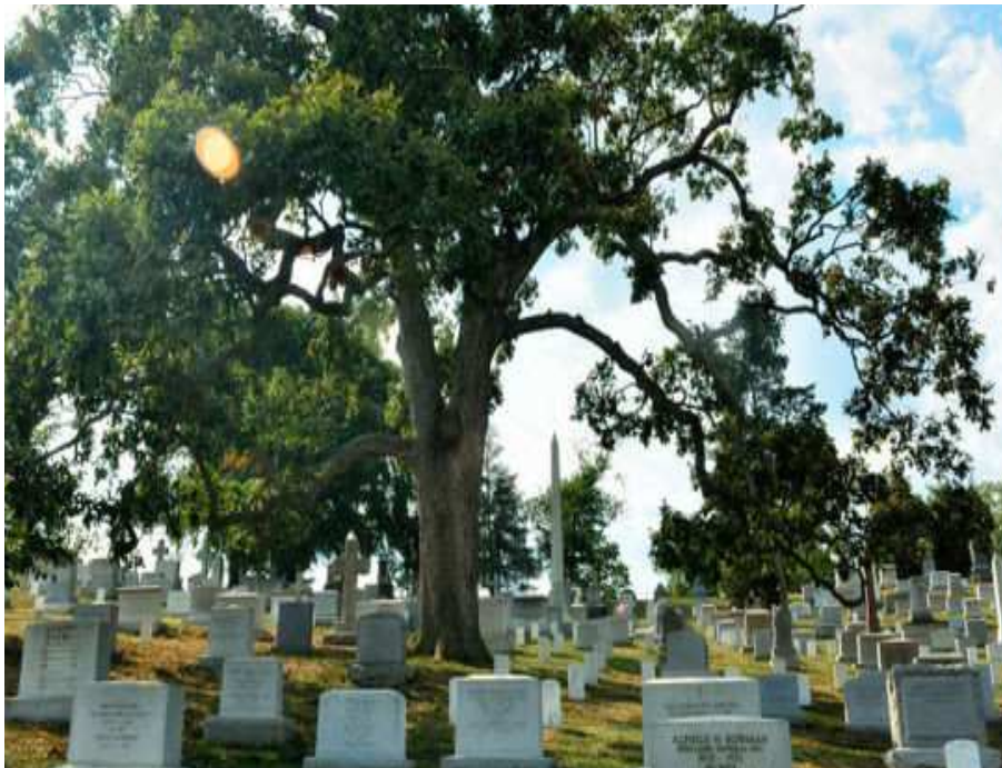
美國阿靈頓（Arlington National Cemetery）國家級軍人公墓。

緣○○鎮公所清潔隊約聘人員湯○○，於擔任該所第 13 公墓納骨堂管理員期間，明知將骨灰置放上開納骨堂，依該鎮殯葬管理自治條例第 16 條之規定，申請人應辦理相關手續，並應繳清使用費、管理費始得入堂。再依同條例附表所規定，符合同條例所規定「本鎮籍」規定者，其使用費始有優惠，否則即應依「非本鎮籍」收費。湯○○竟基於對主管事物違背法令圖申請人不法利益之犯意，明知申請人既不符「本鎮籍」之規定，復尚未辦理相關手續及繳清費用，卻於 98 年至 99 年間擅自允許蔡○○、劉○○、吳○○等 3 人，先將其亡故家人之骨骸放置於懷恩堂納骨櫃位內，並於遲延多日後，始以「本鎮籍」之身份，辦理相關手續繳費，因而使蔡○○等 3 人獲得減免本鎮籍與非本鎮籍之使用費差額之不法利益。嗣經該所民政課里幹事陳○○盤點時發現上情呈報政風室報請法務部調查局○○縣調查站查獲。