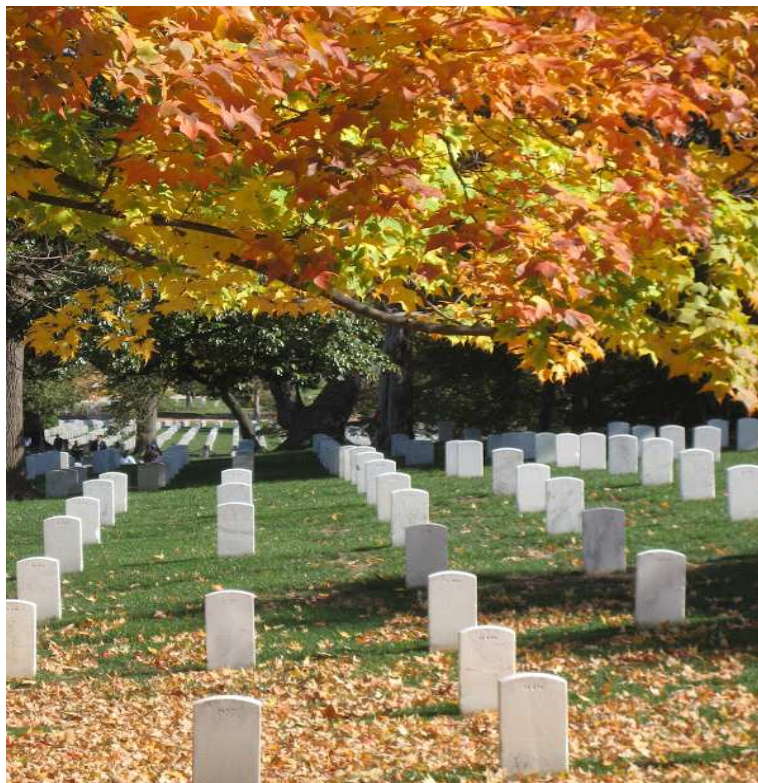
美國阿靈頓（Arlington National Cemetery）國家級軍人公墓一景。

緣○○市殯葬管理處第○殯儀館之技工、工友15人，係負責遺體洗身、化妝、入殮等工作之公務員。明知按其「殯葬設施及服務收費基準表」規定，所提供每具遺體洗身、化妝、入殮之服務，僅各收取新臺幣（下同）350元、300元、300元之法定規費，不得藉故再收取任何費用，竟共同基於對於其職務上之行為收受賄賂之犯意，分別於101年8月至同年10月間執行入殮職務時，向受託處理殯葬事宜之殯葬業者收取賄賂（每具遺體收取600元或1000元不等）。該集體收賄犯行經民眾檢舉，嗣法務部廉政署爰於同年10月16日搜索涉案斂工及殯葬業者而偵破，報請臺灣臺北地方法院檢察署檢察官偵查起訴。