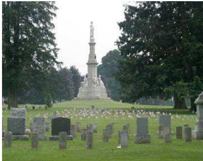
葛底斯堡國家公墓

某地檢署 98 年 9 月間接獲檢舉，指某殯葬管理所向業者收賄，檢察官立即指揮當地調查站展開調查。未料，一個月後，一名女飼主在火葬場外哭說未能見愛犬火化前之最後一面；由於依規定火葬場不能燒動物遺體，加上檢調又監聽到有收受紅包等違法情事，經約談殯葬業者，隔年 1 月 19 日即搜索該殯葬管理所，聲押其火葬班長及班員等 2 人。而查獲該所受理火葬時，依規定只可以向設籍外縣市的往生者家屬收取 6,000 元的撿骨規費，但火葬班長等人卻在核發火化許可證後，以「正爐」、「候爐」之名義向葬儀社另收取 1,000 至 3,000 元不等費用。另遺體收殮班長等人則以「進館費」、「禮堂家祭室清潔費」等名目，向殯葬業者收取 300 元到 3,000 元不等費用。案經法務部調查局○部地區機動工作站移送臺灣○○地檢察署檢察官偵查起訴。