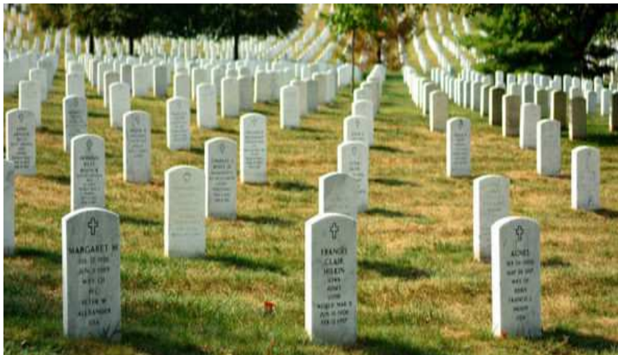
美國阿靈頓（Arlington National Cemetery）國家級軍人公墓。

被告甲○○、乙○○分別為臺東縣○○市公所任民政課課員（甲○○於 92 年 10 月 28 日任○○市殯葬管理所首任所長）、公墓巡查員，2 人於 92 年間負責辦理該市第二公墓遷葬工程之前置作業、規劃、監工及執行，2 人均明知該所與坤合公司簽訂第二公墓遷葬工程合約預估尚未遷葬墳墓僅 840 座，每座墳墓作業單價為新臺幣 880 元，履約期限自契約訂定之日起 40 個工作天，惟承包商並未依簽訂之合約內容施作，而係將先前挖掘出無主骨骸分散重新組合拍照，以浮報虛增挖掘墳墓、遺骸數量方式計價，甲○○並代「坤合公司」擬具 92 年 10 月 23 日申請延長工期申請書，且另簽報「新增無主骨骸挖出約兩千具，以合約單價每具 880 元計算，需經費 1,760,000 元，連原合約預算額共需經費約 2,768,200 元」後，由被告乙○○、甲○○製作結算明細表，浮報挖掘「無名氏」墳墓、遺骸之數量報請結計工資，嗣依市長指示方式辦理驗收後，由該所公庫存款帳下支付 2,218,139 元，以此方式圖利「坤合公司」，使其獲得不法利益近百萬元。檢察官因認被告甲○○、乙○○均涉犯貪污治罪條例第 6 條第 1 項第 4 款之圖利罪嫌而提起公訴。