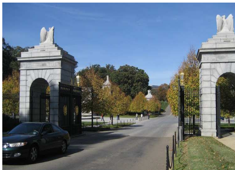
美國阿靈頓（Arlington National Cemetery）國家級軍人公墓墓園入口。

癸○○於擔任○○市殯葬管理所服務組技工期間，先後於民國 92 年 2 月至 95 年 6 月間參與辦理該市○○區第一公墓、第八公墓及二等七號公墓墓區範圍內有（無）主墳墓之遷葬補助作業，或為遷葬小組成員，或為主辦，負責主管該遷葬範圍內之墳墓清查、編號列冊及墳墓遷移現場拍照等事務。詎癸○○竟利用其承辦多次遷葬事務之職務上機會，或與壽○禮儀社公司負責人午○○及其員工申○○，或與禾○禮儀用品社之負責人已○○，先後共同基於詐取墳墓遷葬費之概括犯意聯絡，多次與無犯意聯絡而有詐領意圖之申請人，冒稱係無主墳墓之後人，分別向該所提出墳墓遷葬許可之申請，以取得前揭公墓內墳墓遷葬許可證，復由癸○○在各該遷葬證明單簽證後，據此向該市政府或該所申請每座墳墓 75,000 元或 35,000 元至 45,000 元之遷葬補助費，致該市政府或該所承辦人員陷於錯誤，如數分別支付遷葬補助費予申請之詐領人，癸○○、午○○、申○○及己○○等 4 人並分別從中分得部分款項。案經法務部調查局調查站移送臺灣臺南地方法院檢察署檢察官偵查起訴。