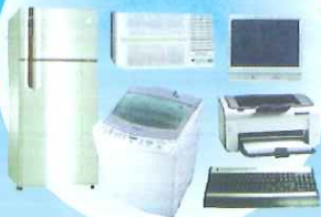
大型廢家電 及資訊物品