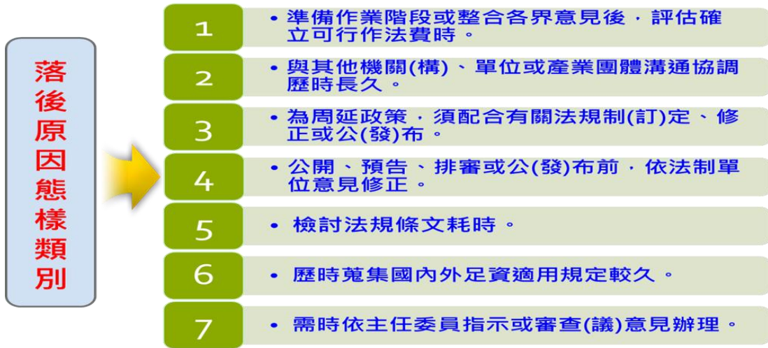
表 3 法案法制作業落後原因態樣類別表