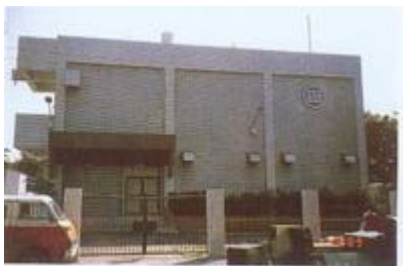
長治鄉電信局全貌