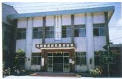
長治農會繁華辦事處全貌