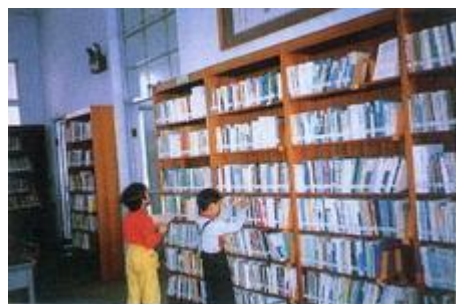
開架式的藏書方便借閱