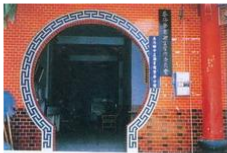
中正圖書館繁華分館