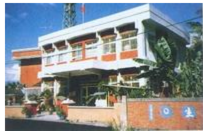
長治鄉戶政事務所全貌