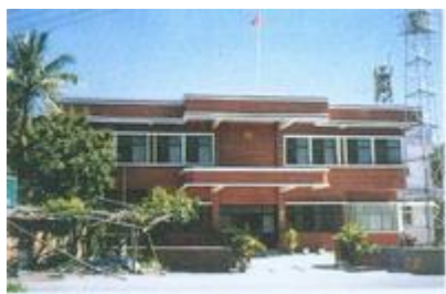
長治鄉分駐所全貌