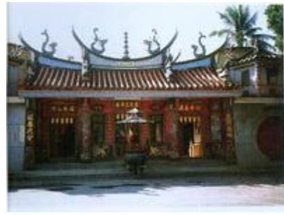
進興村玄天上帝廟