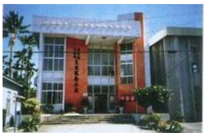
長治鄉民代表會全貌