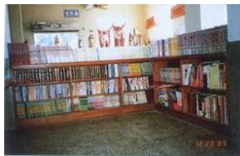
崙上活動中心圖書館