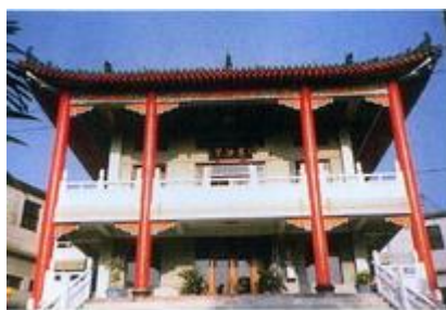
香楊村慈法宮全貌