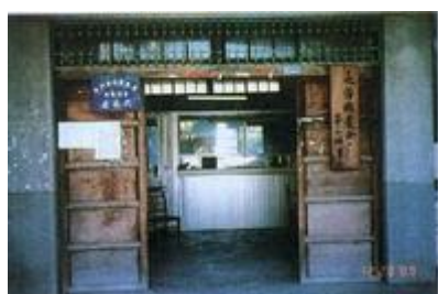
長治農會崙上辦事處全貌