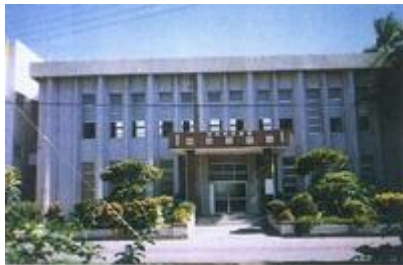
長治鄉中正圖書館全貌