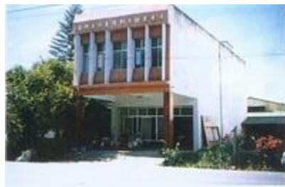
長治鄉水利工作站全貌