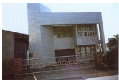
長治農會德協辦事處全貌