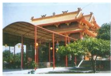
復興村九龍山西歧城宮