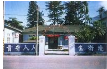
長治鄉衛生所全貌