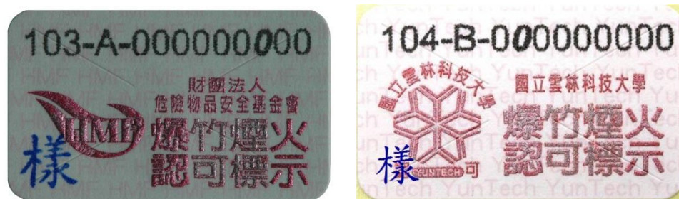
一般爆竹煙火認可標示

(三) 施放場所規定:下列地點不得施放爆竹煙火，違反者得處新臺幣 6 萬~30 萬元罰鍰。