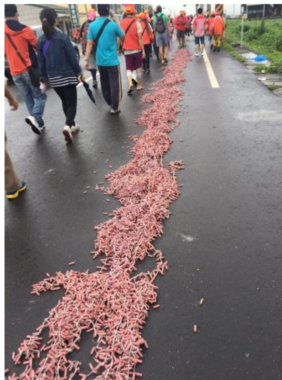
圖、串接或堆疊等錯誤燃放爆竹行為

3.民眾購買一般爆竹煙火時，應選購貼有認可標示之合格產品，並確認產品上是否具有使用說明、廠商資料及主要成分等相關資訊，以確保安全，認可標示範例如下所示。持有未附加認可標示之爆竹煙火，達中央主管機關所定管制量5分之1，處新臺幣3千~1萬5千元罰鍰。