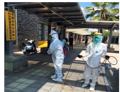
防疫消毒大隊持續展開各項環境消毒工作

縣長潘孟安表示，防疫不忘登革熱防治，因時值夏季適合病媒蚊孳生長，為防範登革熱疫情發生，防疫消毒大隊除了噴灑次氯酸消毒劑，並對環境髒亂點噴灑登革熱環境衛生用藥，加強維護公共環境衛生及民眾健康。環保局呼籲，公共場所防疫工作需要內外兼顧，各場所管理單位也要一起投入防疫消毒工作，針對各場所內部環境，特別是人員經常接觸之表面應有專責人員定期清潔，並至少每天消毒一次（如果顧客頻繁出入，可適度提高消毒頻率）。