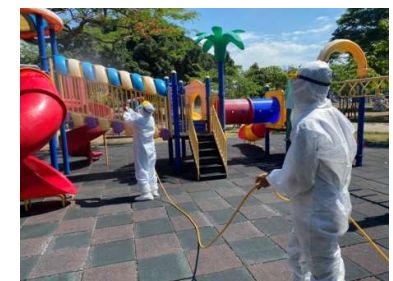
防疫消毒大隊持續消毒每個角落都不放過