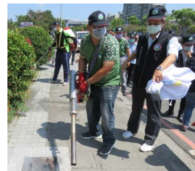
防疫消毒大隊噴藥加強維護公共環境衛生