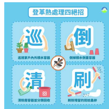
全民落實巡、倒、清、刷，共同防範登革熱