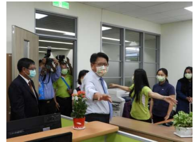
潘縣長及張署長參觀生態節能大樓

潘縣長表示，近年來屏東縣空氣品質、水污染防治、土壤及地下水污染整治及推動因應氣候變遷行動等各項考核均獲特優或優等肯定，包括夜鷹早鳥及天羅地網行動，大幅改善環境品質、成效斐然，在在顯示環保局同仁的努力，特別勉勵同仁硬體與服務全面同步升級，為縣政繼續拼拚努力。