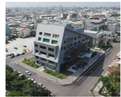
屏東縣政府生態節能大樓落成啟用