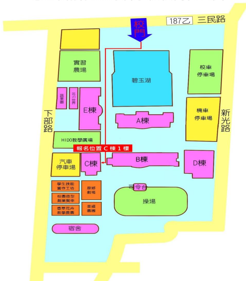
慈惠醫護管理專科學校校內位置圖