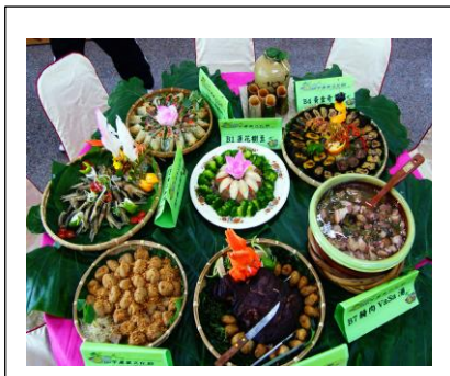
圖 1. 創意料理