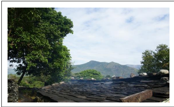
圖 1. 森呼吸之石板屋

老七佳的家屋是以石為瓦、以大石柱為樑、檜木為桁，可以說就是完全由石板蓋出來的房子，老七佳的傳統石板屋是目前排灣族舊部落遺址中，算保留較完整的地方之一。2011年12月9日「世界遺產委員會」決議通過將「屏東排灣族石板屋聚落」更名為「排灣及魯凱石板屋聚落」其中又以老七佳部落石板屋聚落最為完整，算是最具代表性的文化遺產潛力點之一。