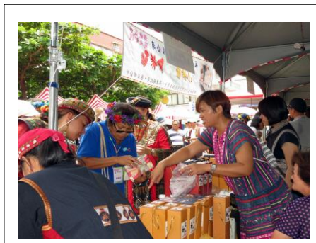
圖 2. 小米釀