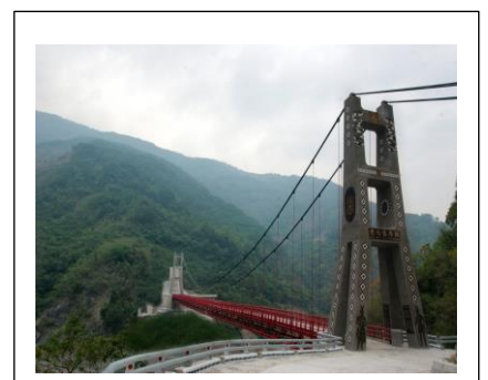
圖 3. 景觀吊橋