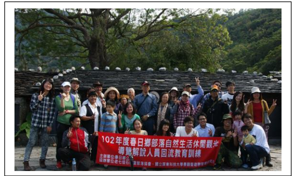
圖 2. 屏東科大學術交流