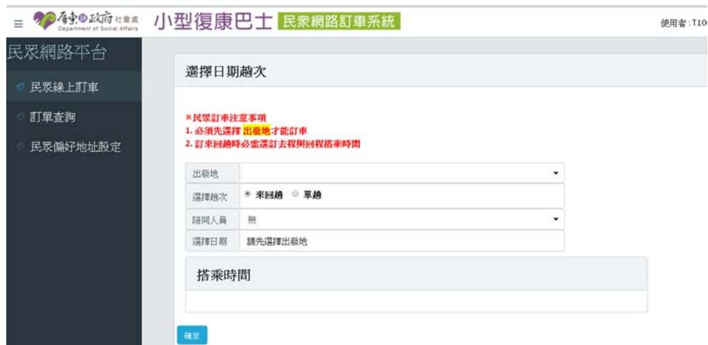
圖 3 民眾線上訂車功能一

重要說明： 系統會依據登入的帳號密碼，判斷使用者當天可開放預約訂車的日期，如發現開放期間有誤請洽客服人員確認使用者相關資料。 如欲於用車前 1 日預約訂車，或預約從高雄市醫院出院返家之車趟，請洽預約專線處理，系統無法受理預約。