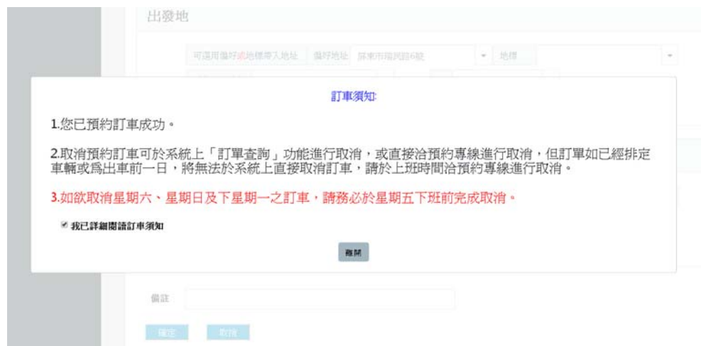
圖 10 民眾線上訂車功能-訂車完成二