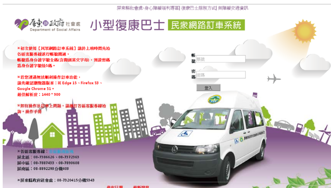
圖 1 系統登入入口網頁