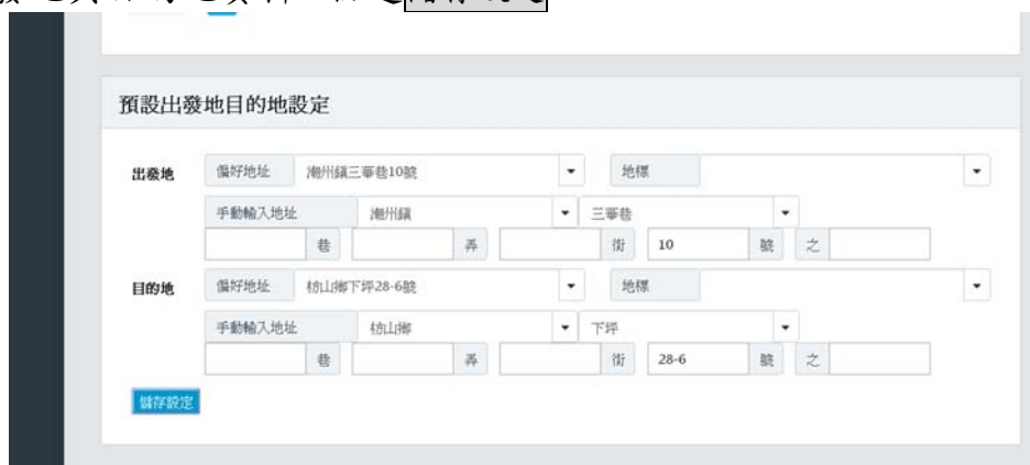
圖 17 預設出發地目的地設定