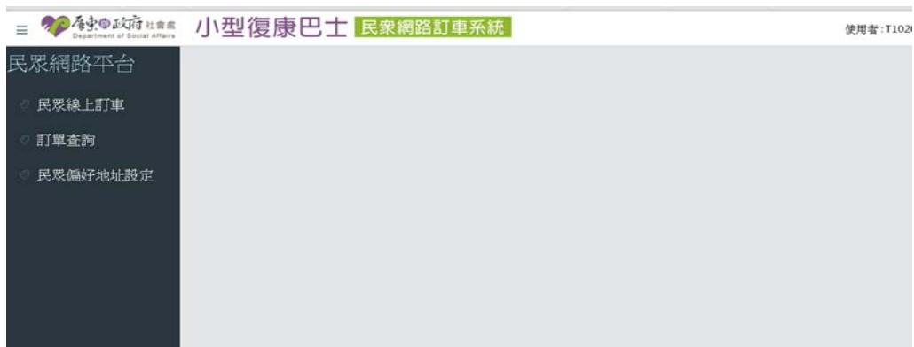
圖 2 民眾登入系統畫面