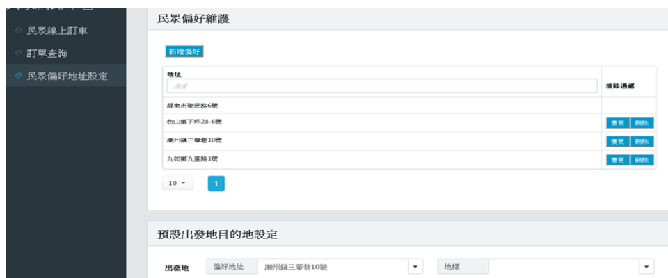
圖 13 民眾偏好地址設定