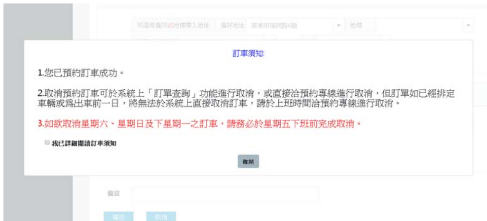
圖 9 民眾線上訂車功能-訂車完成一