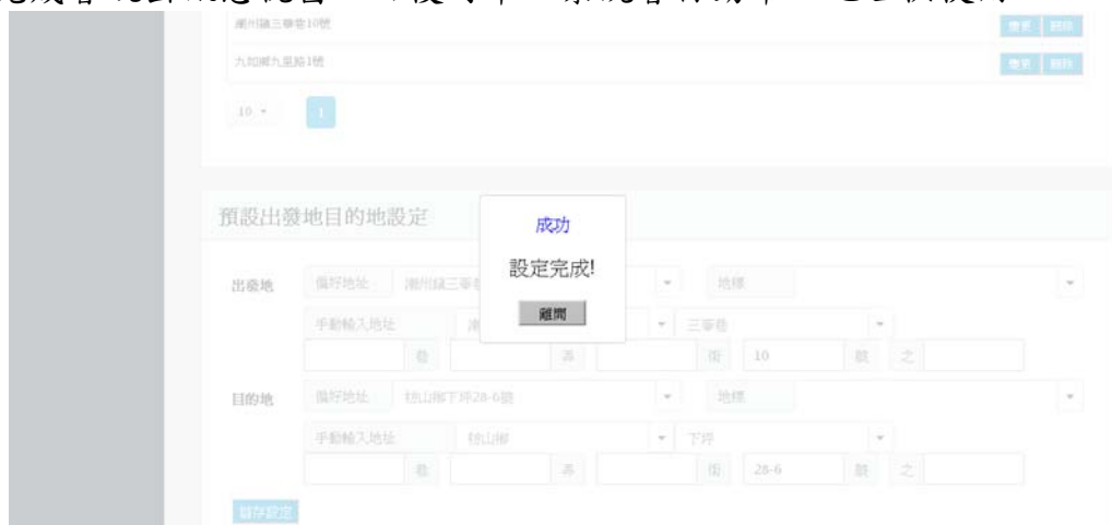
圖 18 預設出發地目的地設定