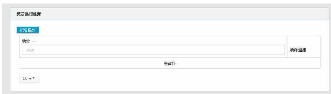
圖 14 民眾偏好維護