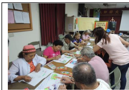
圖 1. 居民參與文化故事繪本

大坵社區積極參與鄉公所社區文化深耕，103 年參與九如文化故事繪本製作，為文化保存盡一份心力。社區理事長推動社區人文關懷，透過牆壁上咖啡、到社區喝杯咖啡的行動，讓更多人關注尊重生命、關懷長者的議題，進而聯結社區關懷據點的成立，落實人文關懷的安居社區。