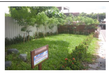
圖 3. 綠意盎然的社區口袋花園