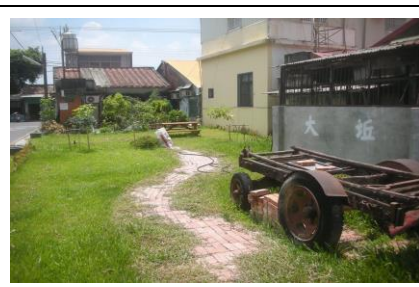
圖 2. 充滿古意的花園