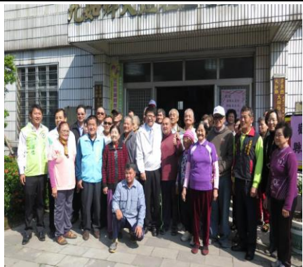
圖 1. 照顧關懷據點成立