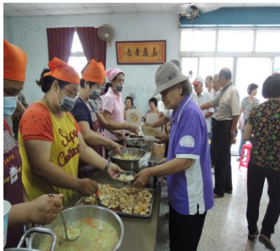
圖 2. 關懷據點的媽媽味