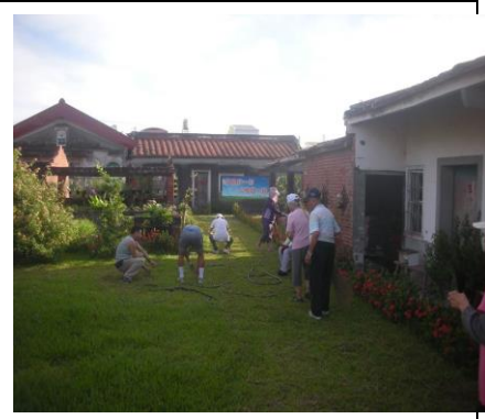
圖 3. 無私奉獻的社區志工