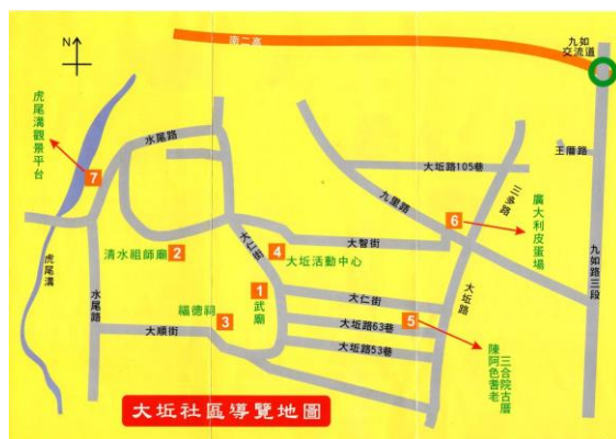
大坵社區導覽地圖