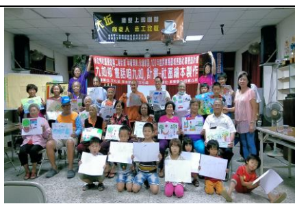
圖 2. 繪下社區的鮮明記憶