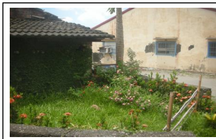
圖 1. 社區花園一隅

大坵社區參與環保署環境改造聯合計畫，將閒置空間開闢成美麗花園，成為居民最佳休閒場所。