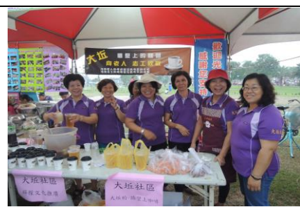
圖 3. 推動人文關懷的牆壁上咖啡