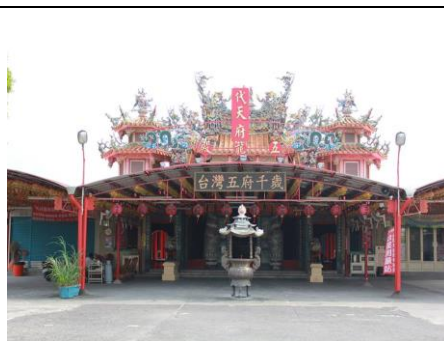
圖 2. 九如鄉後庄代天府