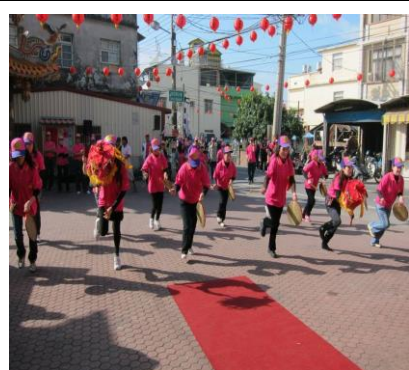
圖 1. 社區民俗技藝跳古陣