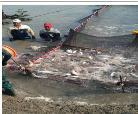
圖 5. 社區養殖產業-鱸魚