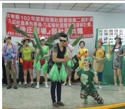
圖 2. 社區劇場凝聚社區共識