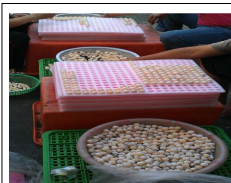
圖 7. 社區養殖產業-甲魚蛋