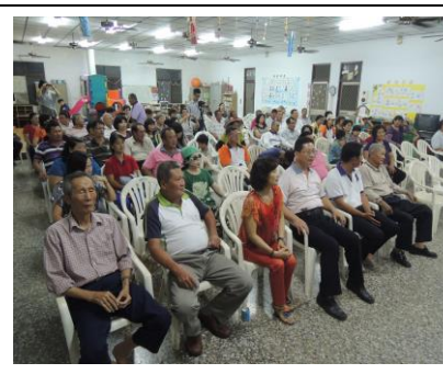
圖 6. 社區居民高度的向心力