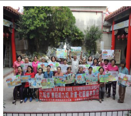
圖 3. 長輩參與社區文化故事繪本