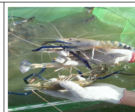
圖 8. 社區養殖業-泰國蝦