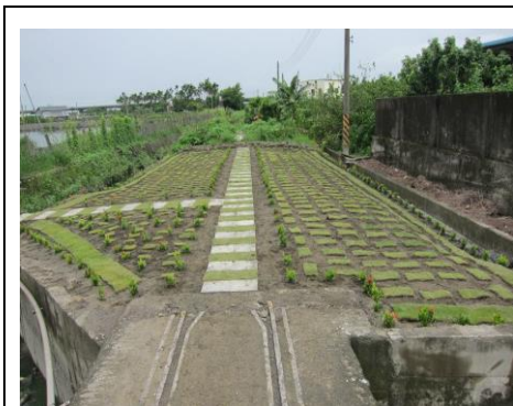
圖 4. 社區花園