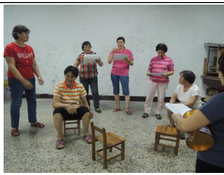
圖 5. 居民參與社區劇場