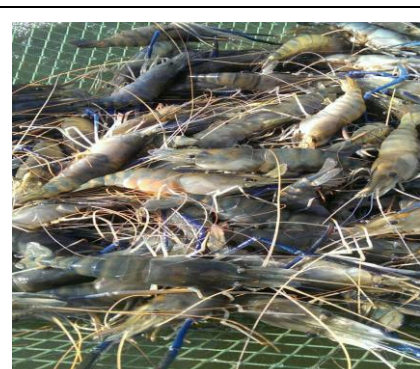
圖 9. 社區養殖產業-泰國蝦