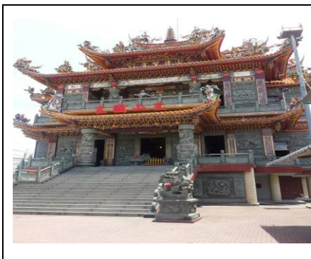
圖 1. 三山國王清聖宮