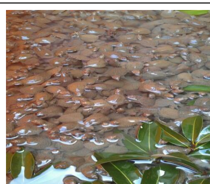
圖 6. 社區養殖產業-甲魚