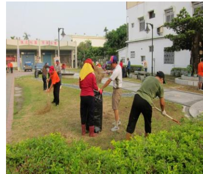
圖 3. 認真的志工群整理社區環境