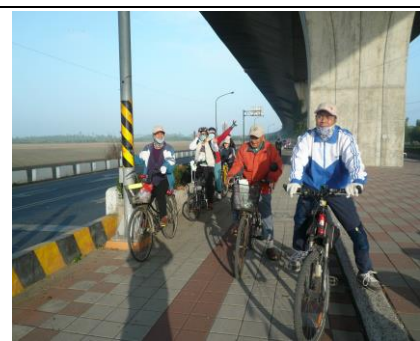
圖 3. 蘭花蕨鐵馬道