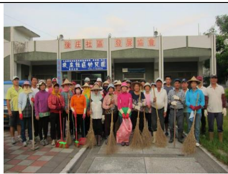
圖 4. 陣容龐大的志工群