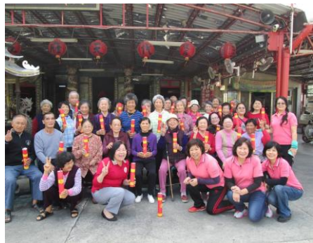
圖 1. 成立社區照顧關懷據點