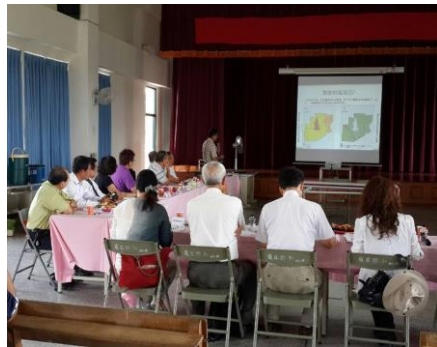
圖 2. 後庄通過農村再生計畫