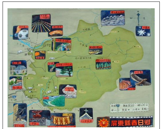
屏東系春日鄉景點圖

http://reader.roodo.com/visualart/archives/10323839.html