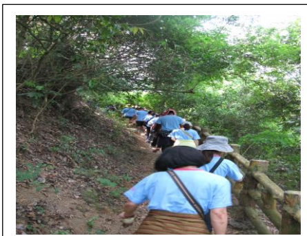
圖 2. 力里山