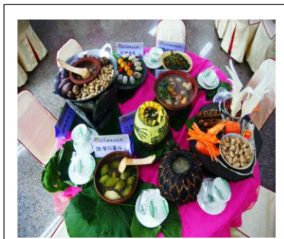
圖 1. 創意料理