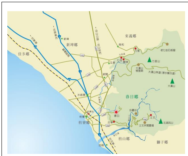
屏東縣春日鄉交通圖