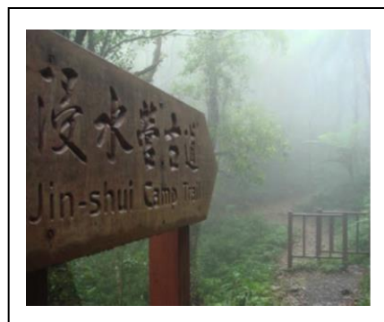
圖 3.浸水營古道轄區內