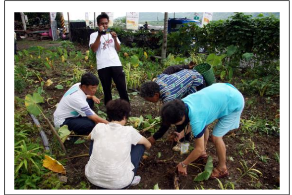
圖 2.遊客採山芋體驗