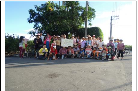
圖 1. 社區路口耕者之家精神堡壘