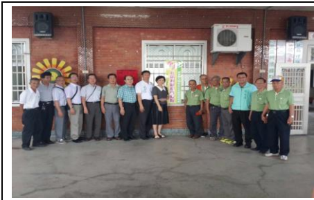
圖 1. 成立社區照顧關懷據點