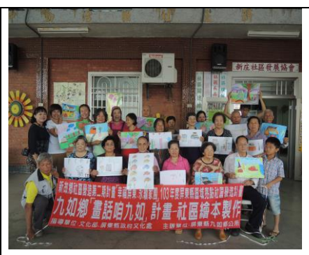
圖 1. 社區居民參與社區地圖繪製