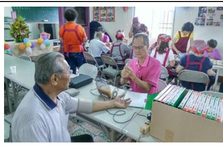
圖 2. 阿公阿嬤來據點上課