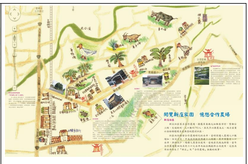
新庄社區文化地圖