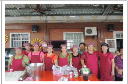
圖 3. 有活力的志工媽媽