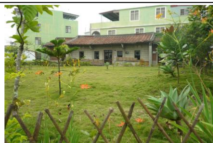
圖 2. 美麗的郭家花園