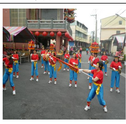
圖 1. 社區文化故事繪本一