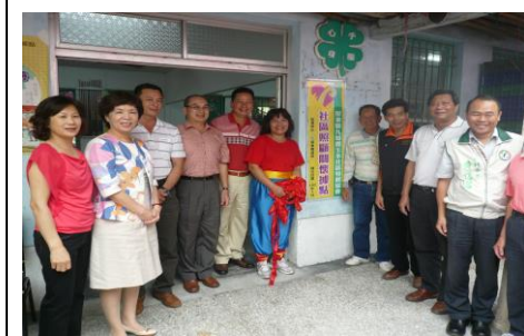
圖 1. 成立社區照顧關懷據點