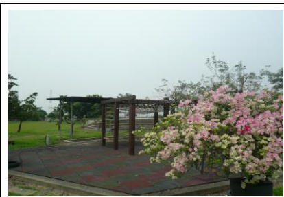
圖 3. 美麗的吳家花園