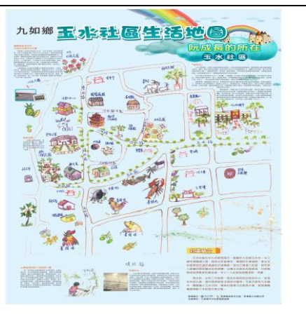
玉水社區生活地圖