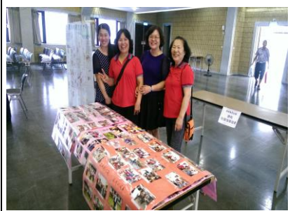
圖 3. 榮獲 103 年度屏東縣績優社區