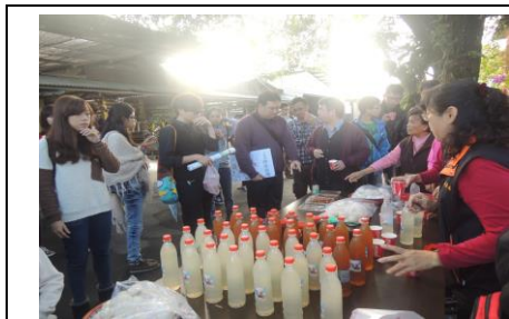
圖 1. 檸檬海燕窩