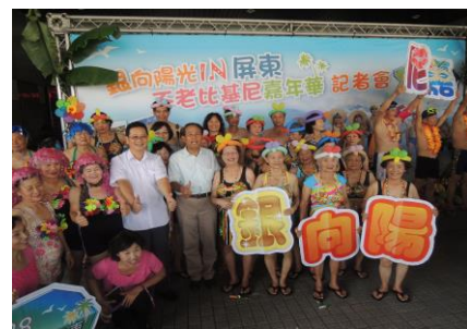
圖 2. 活力滿滿的關懷據點