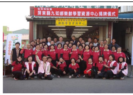
圖 2. 成立九如鄉樂齡學習中心