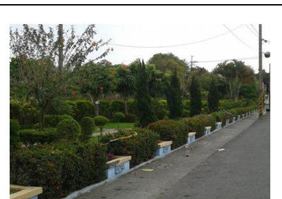
圖 3. 社區花園之三