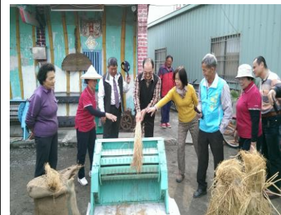
圖 1. 社區內收藏的古農具