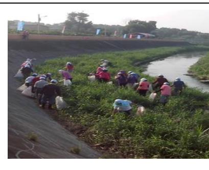
圖 3. 參與環保局環境改造計畫 舉辦護溪淨溪活動