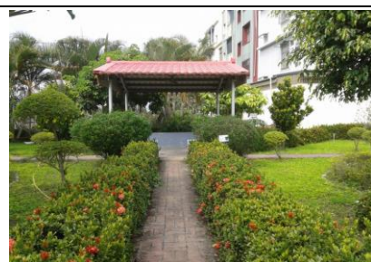
圖 2. 社區花園之二