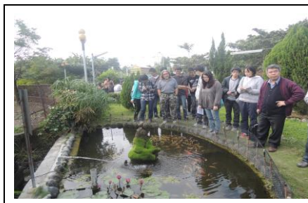
圖 1. 社區花園之一

九明社區是九如鄉首重環保的社區，社區歷年來參與環保局環境改造計畫，社區呈現整潔乾淨的景觀，社區將髒亂點及閒置空間打造成美麗的社區花園，是全國知名的環保觀摩示範社區。