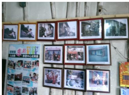
圖 2. 社區內收藏的古農具