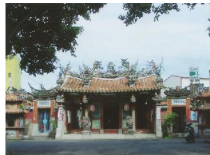
圖 3. 九塊厝三山國王廟