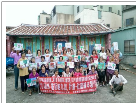
圖 1. 成立社區照顧關懷據點