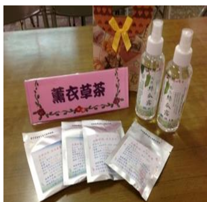
圖 2. 社區花草茶包