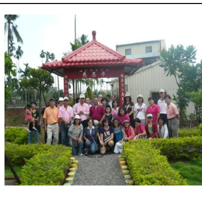
圖 2. 社區花園的美景