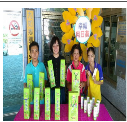
圖 3. 社區天然水果釀醋