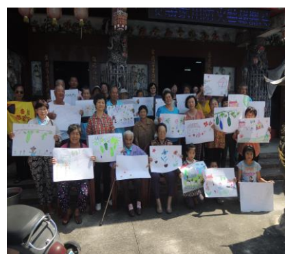
圖 1. 昌榮的文史-番社庄誌