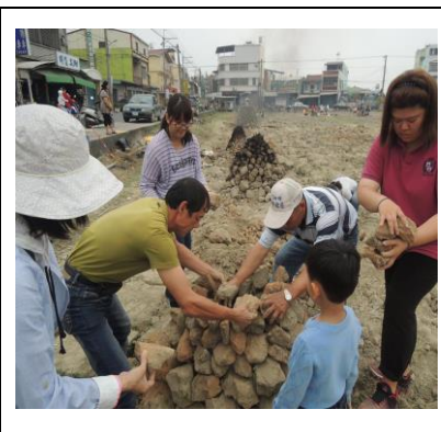
圖 3. 社區舉辦焗土窯活動