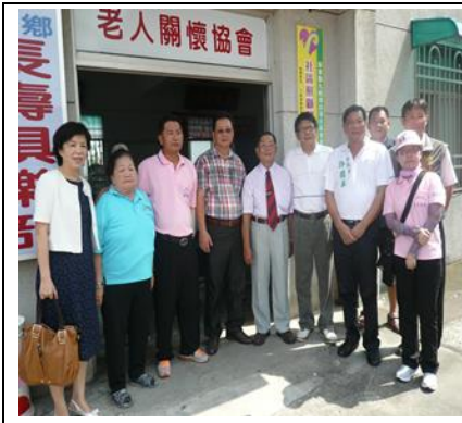
圖 1. 成立社區照顧關懷據點