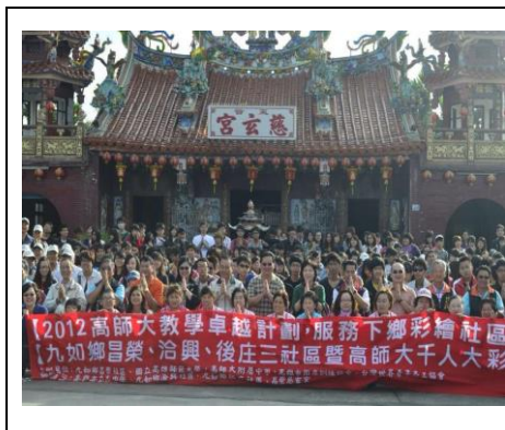
圖 1. 社區居民信仰中心昌榮慈玄宮