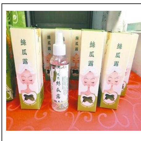
圖 1. 天然復古的絲瓜露