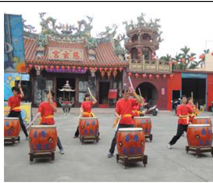
圖 2. 太鼓隊參與演出