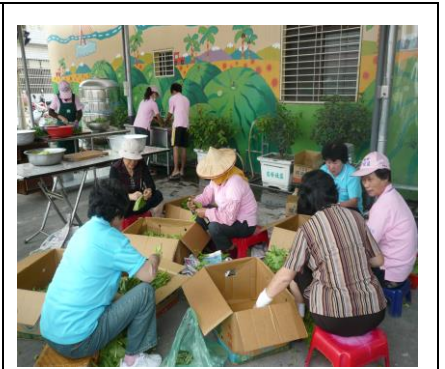
圖 3. 熱心服務的志工隊