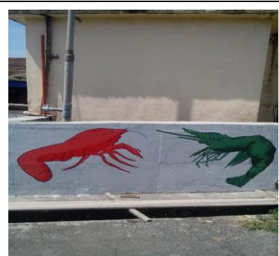
圖 3. 社區養殖產業-魚蝦彩繪