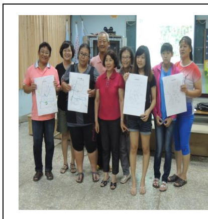
圖 1. 居民參與社區地圖繪製