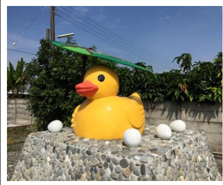
圖 1. 社區的黃色小鴨

洽興打造屬於自己社區的黃色小鴨 LOGO，也推展社區環境改造計畫，社區閒置空間開闢成美麗花園，成為居民最佳休閒場所。