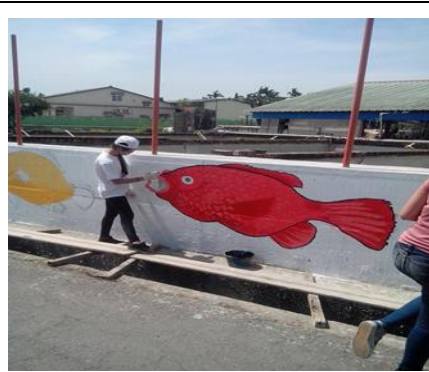
圖 2. 美麗的社區彩繪