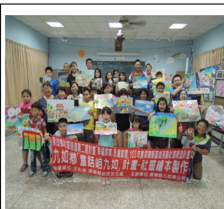
圖 3. 居民參與文化故事繪本製作