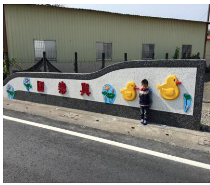
圖 2. 美麗的洽興樂園