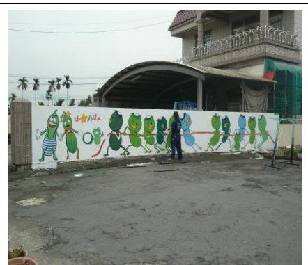
圖 3. 美麗的社區彩繪