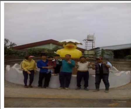
圖 1. 洽興社區黃色小鴨 LOGO