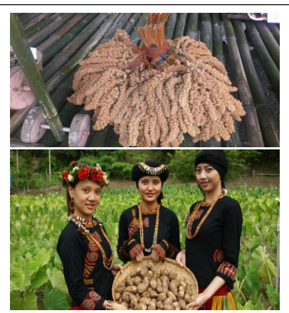
圖 3. 小米/山芋田