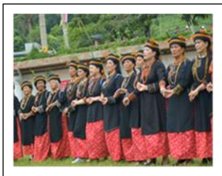
圖 1. 豐年祭

士文村由卡士奉案、古拉扯奧、籃併、丹列、普及部當、爪里奴姑子等諸社合併譯名，現住戶 90 戶，人口 418 人，居民為排灣族原住民。士文村是春日鄉最高的部落，海拔約四百公尺，東與台東縣達仁鄉為界，村內建築物都是依山而建。觀光資源士文，休閒農場可野餐、露營，古士（士文）道路可眺望高屏平原和台灣海峽，北湖呂山林相優美，古華國小士文分校有二棵百年老黑松。