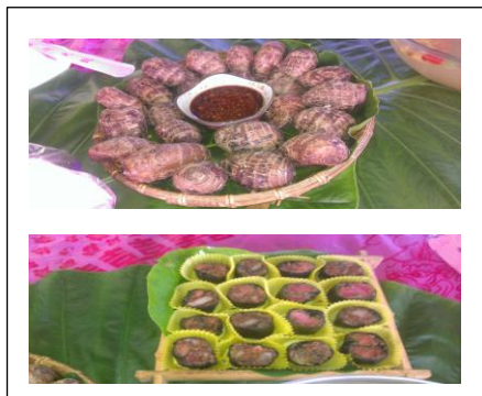
圖 1. 創意料理