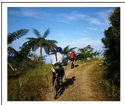
圖 3. 北湖呂山

http://blog.yam.com/x2media2x/article/33369244