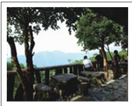
圖 2. 士文自然休閒農場