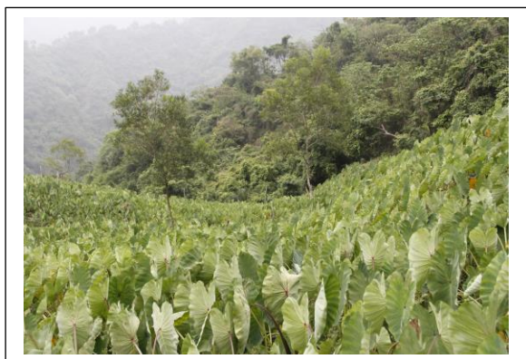
圖 1. 森呼吸山中之芋

最具特色的農特產就是「山芋」(排灣族語 vasa)，尤其源自春日鄉的子芋，是民國 79 年由高雄農業改良場自春日鄉士文村部落蒐集而得。經過繁殖、純化及進行各項栽培相關試驗後，於 91 年 12 月提出新品種命名登記申請，92 年 1 月通過行政院農業委員會審查，正式命名為「高雄二號」目前在山地鄉普遍種植的山芋，多數都是這個品種，因此春日鄉也可以稱為「山芋的故鄉」、「山芋的母親」。