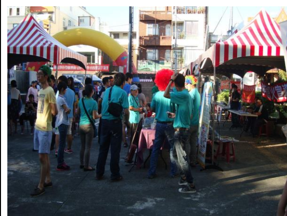
環保局闖關遊戲攤位