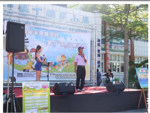
恆春區漁會理事長致詞