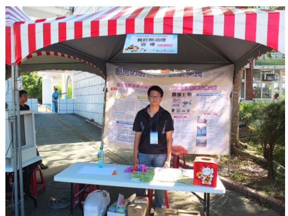
廚房無油煙宣導攤位