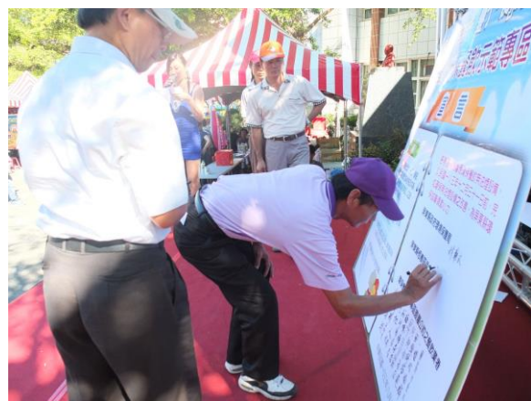
後壁湖環保餐飲示範專區 簽署