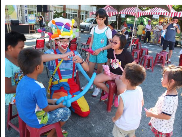
氣球街頭藝術表演者現場互動