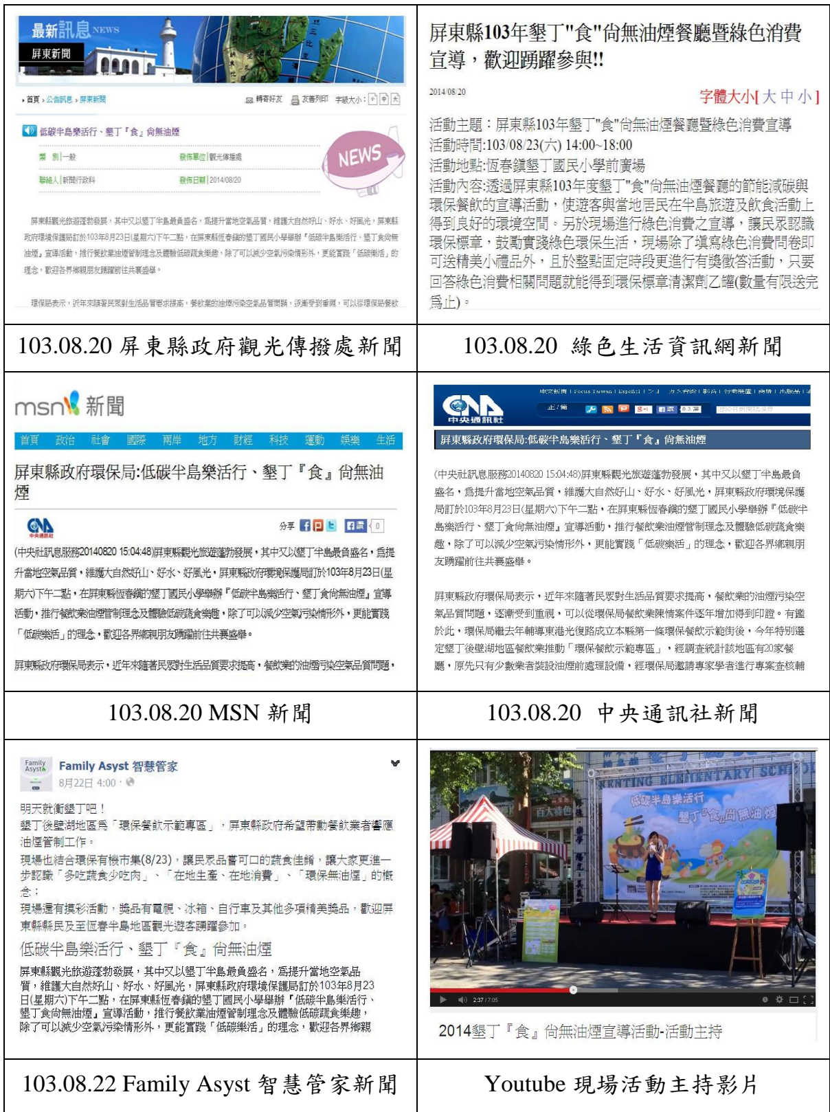
圖 6 環保餐飲示範街媒體宣傳