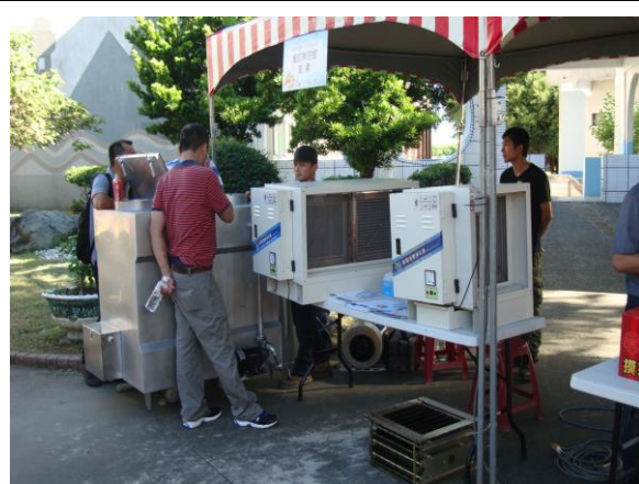
廚房油煙管末防制設備展示