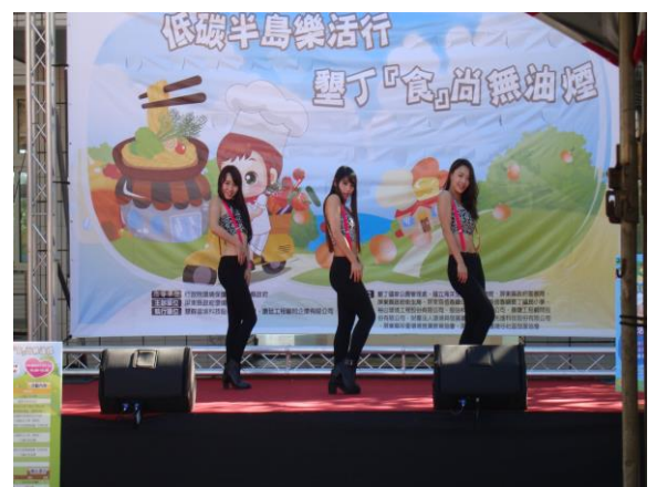
現場熱歌勁舞表演