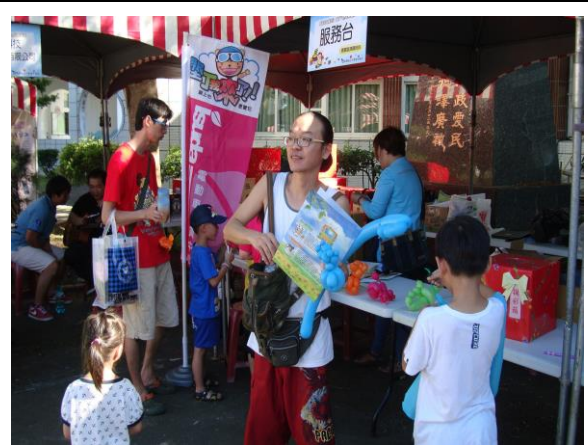
闖關遊戲卡及摸彩卷兌換區